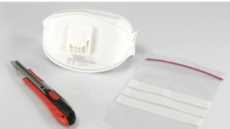
Materiali per il prelievo di campioni da stucco per finestre e rivestimento per pavimenti in materiale sintetico